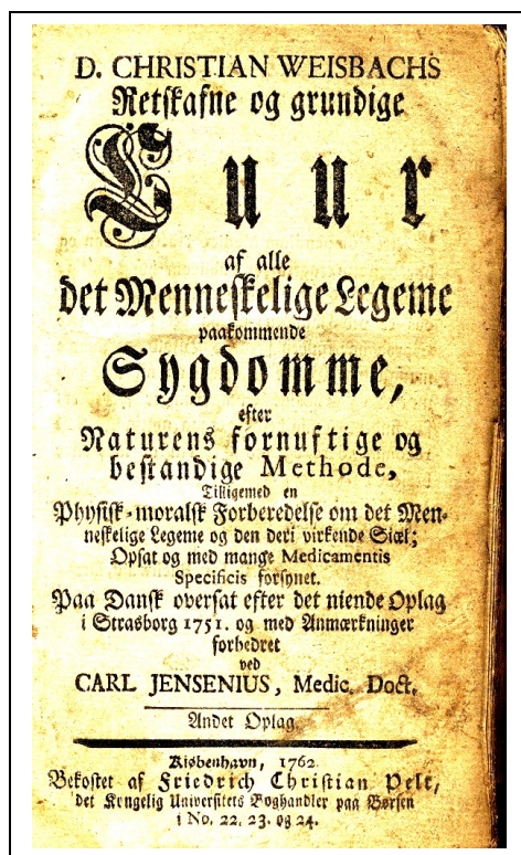
Den gamle lægebog fra 1751.

Her gives gode råd mod alle former for lidelser, også de psykiske.